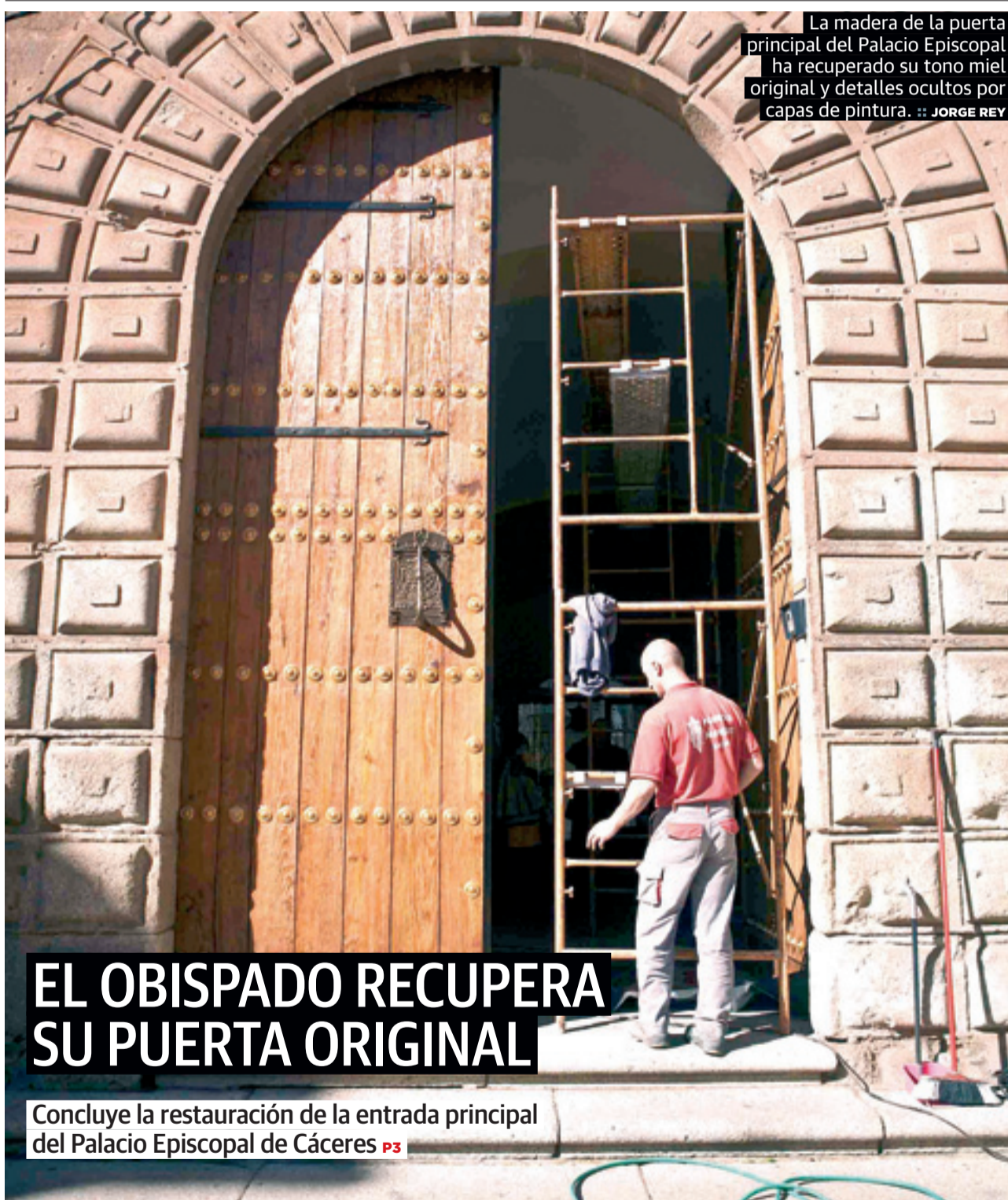
La madera de la puerta principal del Palacio Episcopal ha recuperado su tono miel original y detalles ocultos por capas de pintura.

de su antecesor al frente de la Reserva Federal de EE UU, Bernanke P25